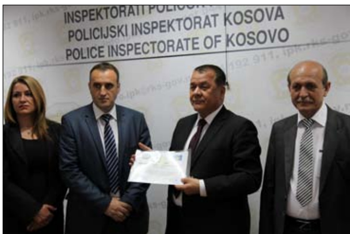
PAMJE NGA VIZITA E DELEGACIONIT NGA AFGANISTANIT

Femra në Inspektoratin Policor të Kosovës si një nga institucionet e rëndësishme të sigurisë në Kosovë, ka përfaqësim të mirë me një përqindje prej 25% nga totali i punonjësve të Inspektoratit si në nivelin operacional ashtu edhe në atë strategjik