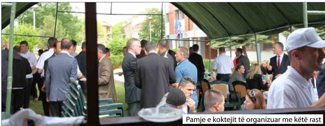
Pamje e koktejit të organizuar me këtë rast

Si pjesë e ceremonisë u ndanë mirënjohje për institucionet që kanë dhënë ndihmesë në rrugëtimin e suksesshëm të IPK-së si dhe për punëtorë të dalluar në punë dhe aktivitete sportive.