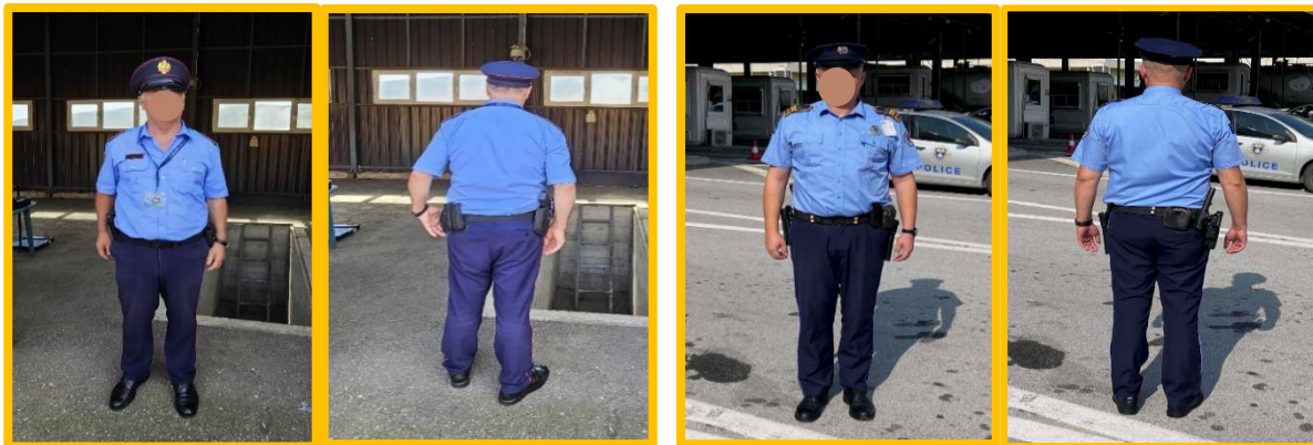
Zaposleni u Policiji Republike Albanije