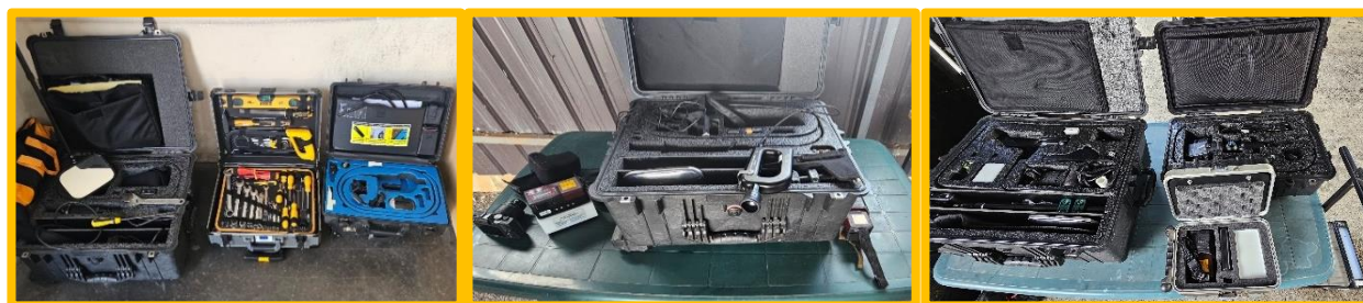
Oprema za opštu upotrebu koja se koristi tokom kontrole linije II

Član 12. Sporazuma reguliše kategoriju i način korišćenja zajedničke opreme, a konkretno u tački 2. ovog člana utvrđuje se: „Službena oprema dveju ugovornih strana neophodna za obavljanje poslova u vezi sa verifikacijom granice u ZZGP, mogu biti instalirane i da se koristi od strane njihovih zaposlenih.”